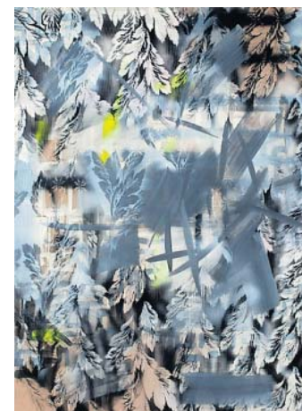
Coen Vunderink, zonder titel