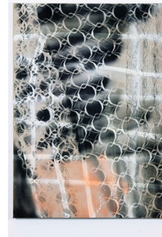
Werk van Wouter Nijland (grote foto links) en Coen Vunderink (hierboven).

decoratieve heeft wat tuttigs en neigt naar kitsch, ware het niet dat de kunstenaar op een geraffineerde wijze traditie met moderniteit weet te verbinden. Door de ruimtelijke toepassing van de vitrage en het transparante karakter ervan, ontstaan vensters op verschillende werkelijkheden in een spannende sfeer van ontbloten en bedekken. Het collectief NULVIJFTIG gebruikt die spanning (en meer) in een opvallende tentoonstelling die de som der delen overstijgt.