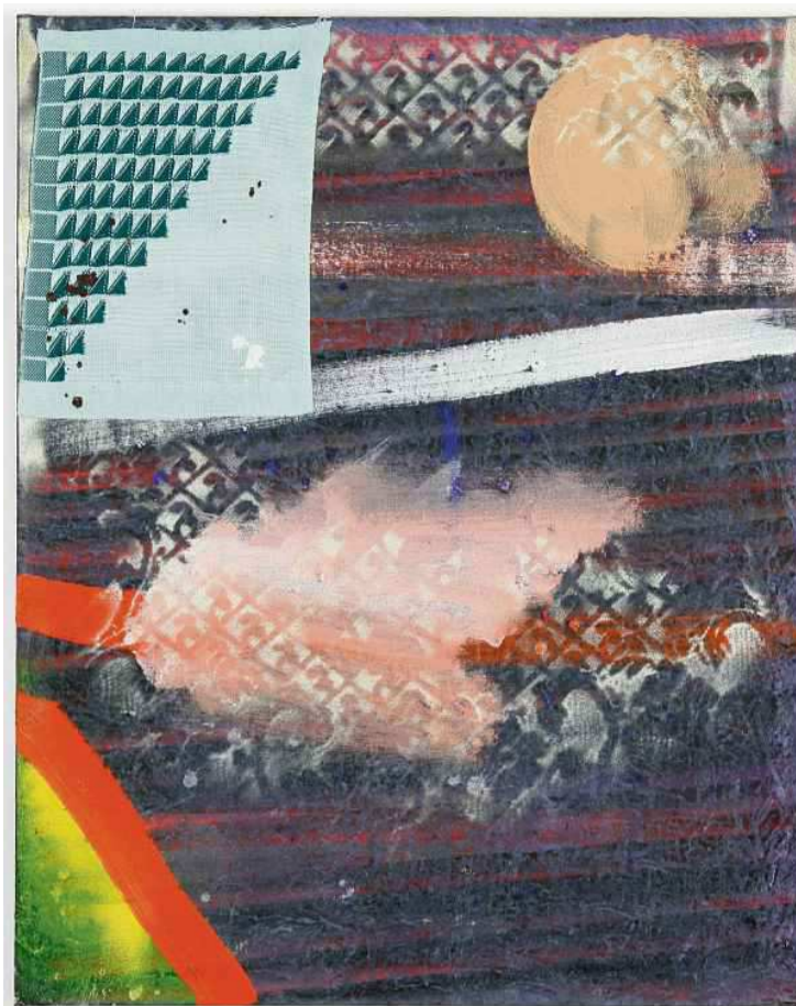
Coen Vunderink - A summer day at the lake